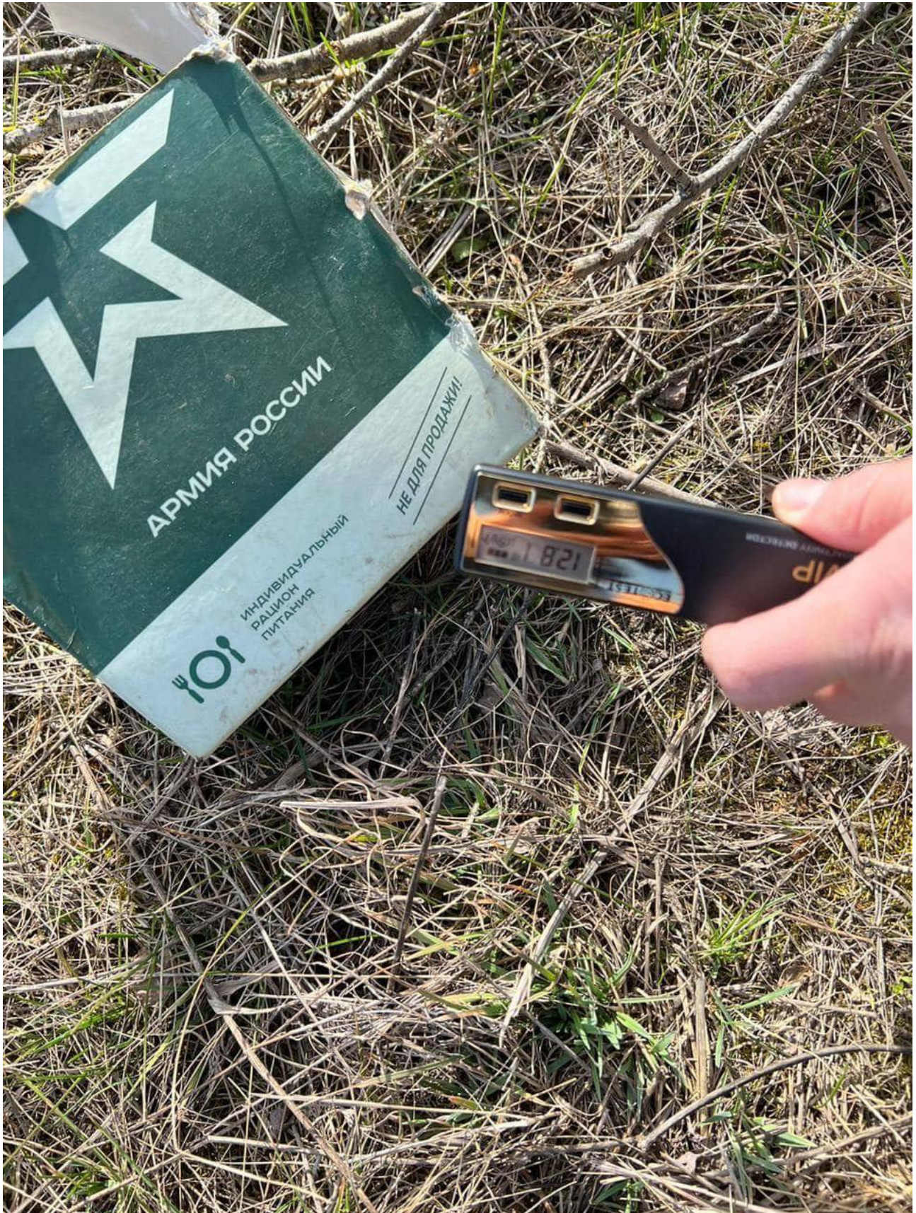
Le truppe russe hanno "deportato con la forza" più di 600.000 ucraini, inclusi circa 121.000 bambini, in Russia. E' quanto afferma la responsabile dei diritti umani del Parlamento ucraino, Lyudmila Denisova.